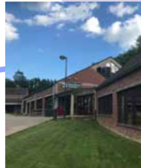
Binnenkort wordt er gestart met e-readers en e-boeken. De Bib zal vanaf volgend jaar ook uitgerust worden met zelfuitleenbathies