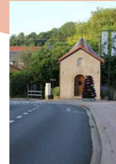
We willen werk maken van vlottere overgangen tussen de fietspaden en de wegen