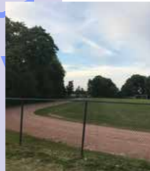
Plannen van een atletiekpark