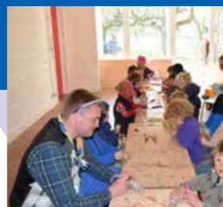
Jaarlijks vangt we honderden kinderen op tijdens de vakanties