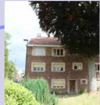
Investeren in zorgwonen voor zorgbehoevenden