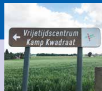
Renovatie Kamp Kwadraat tot een duurzaam en groen vrijtijdscentrum