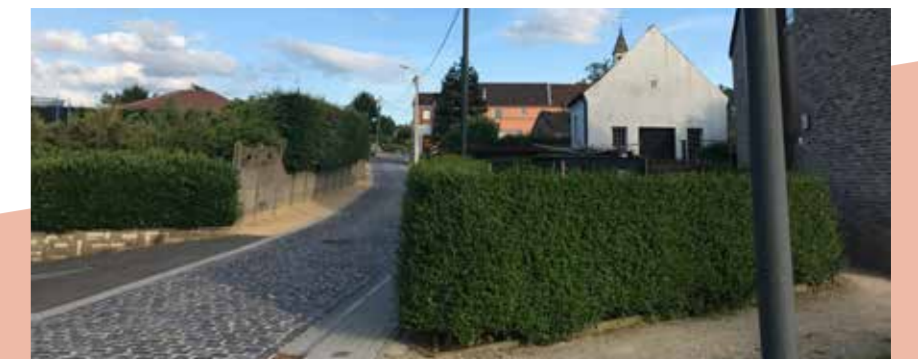
Jaarlijks terugkerend budget voor heraanleg kasseiwegen