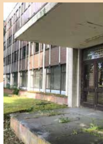
Aankoop Fortis-gebouw om het sociaal objectief te behalen voor betaalbaar wonen