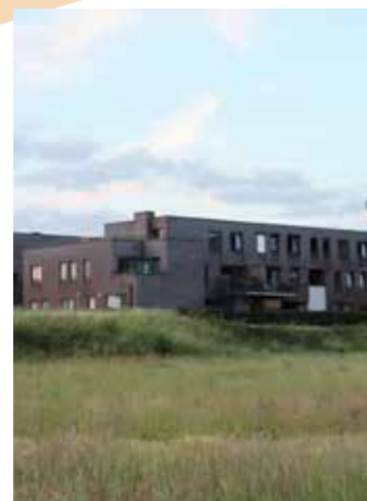
Afbraak vervallen serre zodat Maleizen er een natuurlijke en veilige speelomgeving bij heeft