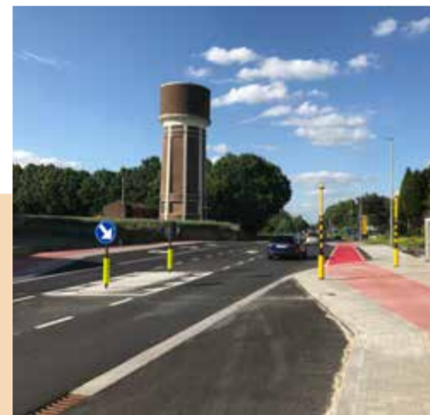
Terhulpesteenweg: zowel riolering als bovenbouw werden aangepakt