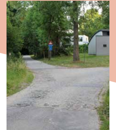
Verbeteren aansluiting fietspad, trage weg van Ballingstraat en Groeneweg