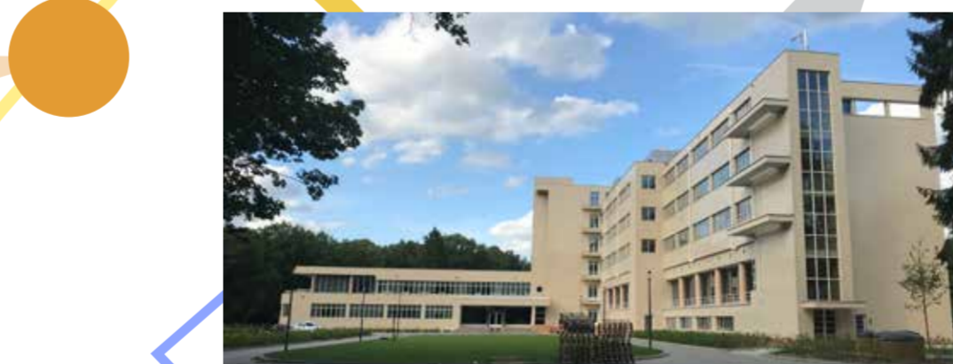
Gemeente investeert mee in erfgoed (Sanatorium) en maakt deze toegankelijk voor elke bezoeker