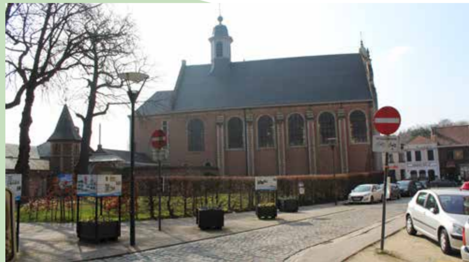
Uitwerken van een toekomstvisie samen met de inwoners van Jezus-Eik