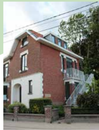
'De Flos' de oude boswachterswoning in Jezus-Eik wordt verworven als gebouw voor de Chiro