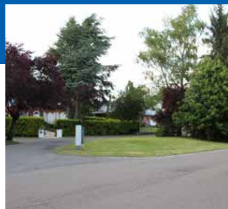
Overstromingen tegengaan in de Marnixlaan door het aanleggen van een groen waterbufferbekken