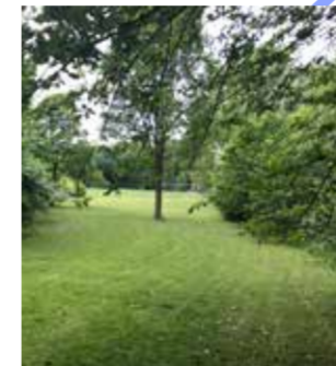
Combinatie van groene waterbuffering en uitbouw van sport en vrijetijdsinfrastructuur