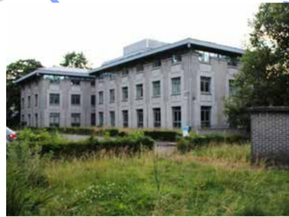
Gemeente verzet zich, samen met de dorpsraad, tegen de komst van een megalomaan project