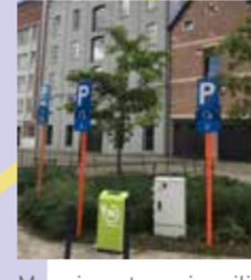
Meer investeren in milieuvriendelijke voertuigen