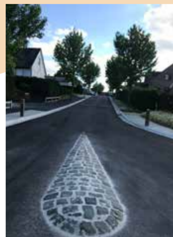
Rioleringswerken en heraanleg straat tot een veiligere woonomgeving