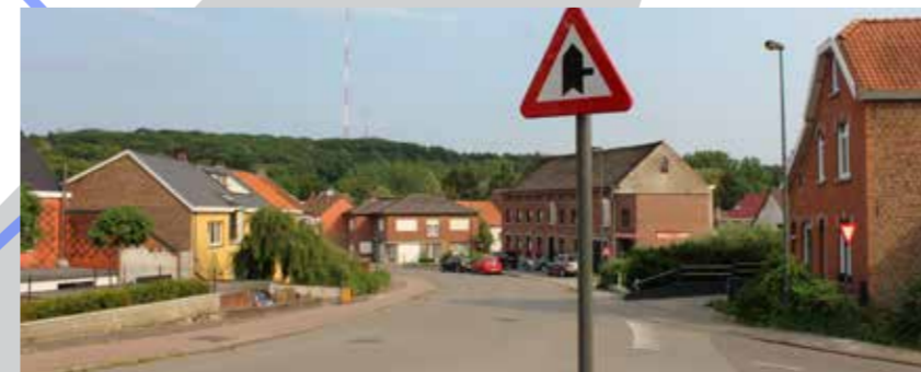
Wijzigingen voorrangregeling op kruispunt Lanestraat / Bergstraat