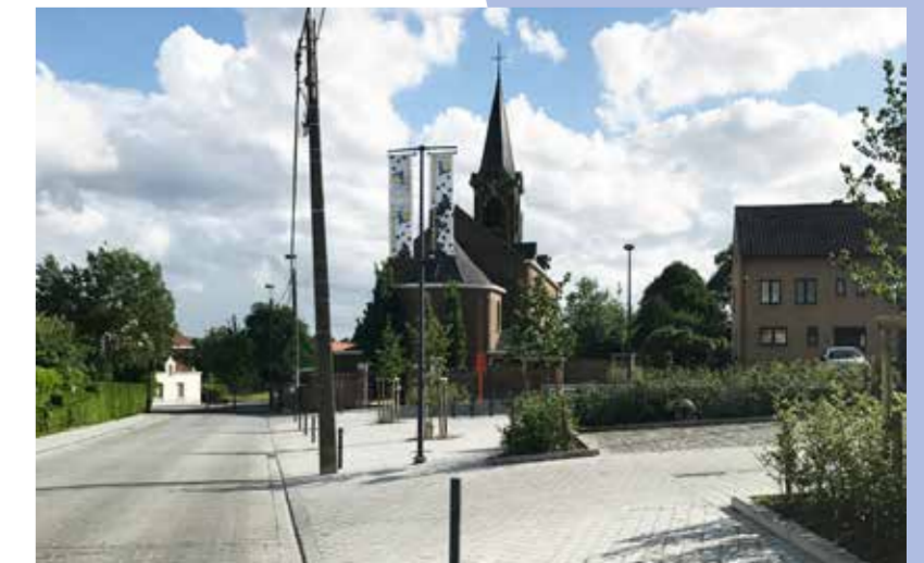
De Bollestraat werd heraangelegd