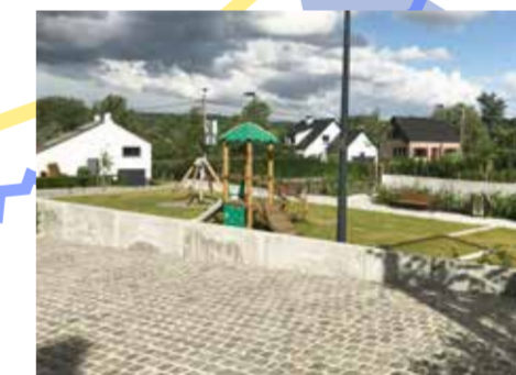
Onder impuls van Overijse 2002 werd het ontwerp van het dorpsplein goedgekeurd en ontwikkeld. Vandaag is het nieuwe plein een aangename ontmoetingsplaats geworden voor jong en oud