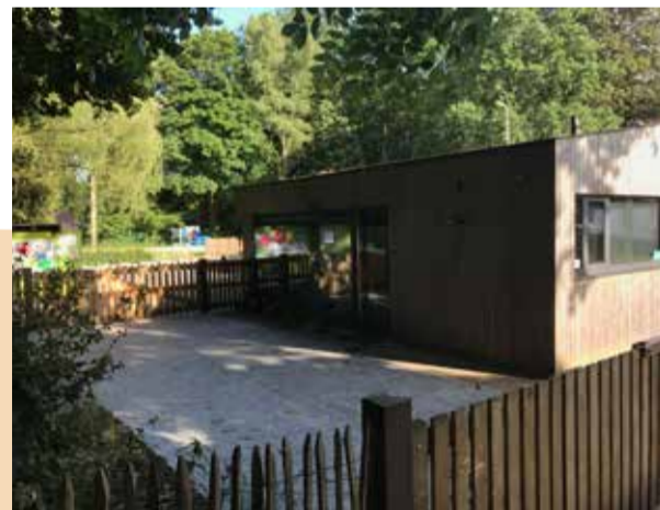
Heraanleg speelplaats kleuterschool Lotharingenkruis