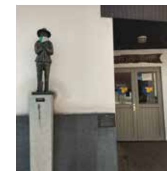
Het sanitair van het "Den Turf" wordt in augustus 2018 grondig vernieuwd