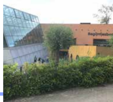
Het begintjesbad is toe aan een doorgedreven renovatie en Overijse heeft hiervoor 450 000 euro subsidies gekregen