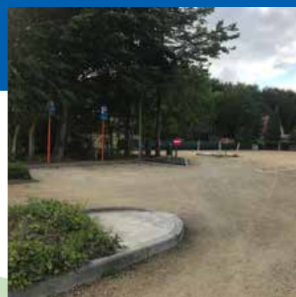
Verbeteren accommodatie Chiro en uitbreiden parking Bosuil- een win-win