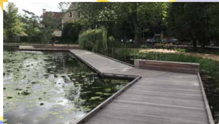
Heraanleg van het park Mariëndal met projectsubsidies "Natuur in je Buurt" van ANB