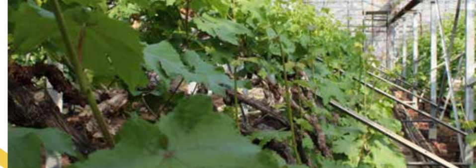
De druif blijft een belangrijk toeristische trekpleister voor Overijse en de Druivenstreek. De serristencursussen zijn een groot succes om de druiventeelt te garanderen voor de toekomst