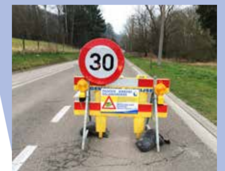
Jaarlijks helpen we telkens honderden padden oversteken